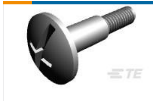
TE 产品编号208211-1 SCREW SHOULDER, SPEC