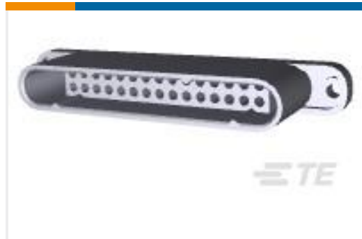
TE 产品编号213974-1 METRIMATE 30P RCPT HOUSING