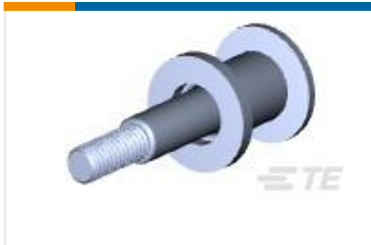
TE 产品编号213283-2 HARDWARE KIT,DRAWER CONN