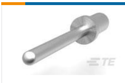
TE 产品编号1650161-1 701-64-02109=CONTACT,PIN,#20