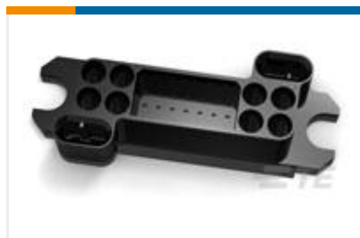
TE 产品编号1648204-1 297-09-01100=SA CONN,PIN