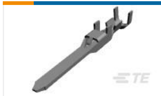
TE 产品编号175288-2 DYNAMIC D-3 TAB CONT. M AU 0.38 L/P