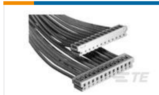
TE 产品编号1-179228-1 CT CRIMP-2 REC HSG 11P NATURAL L/P