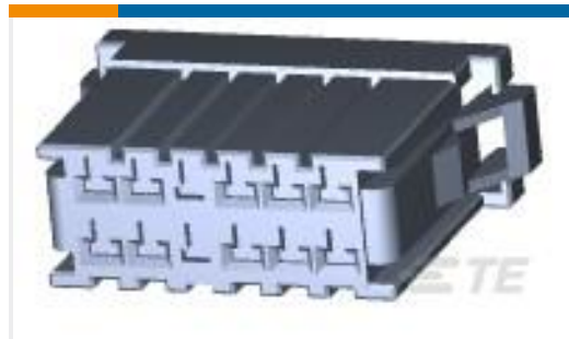
TE 产品编号178289-6 DYNAMIC 3100 REC HSG 12P DBL