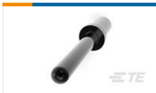
TE 产品编号1766193-1 CONTACT,PIN,SIZE #12