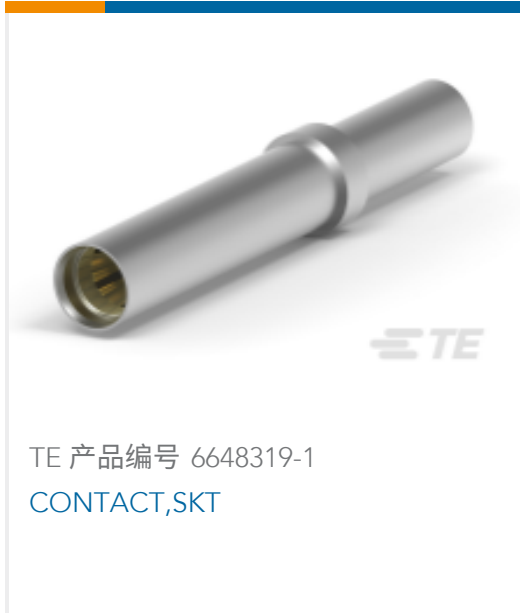
TE 产品编号 6648319-1 CONTACT,SKT