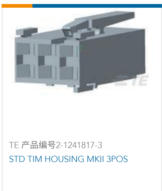
TE 产品编号2-1241817-3 STD TIM HOUSING MKII 3POS