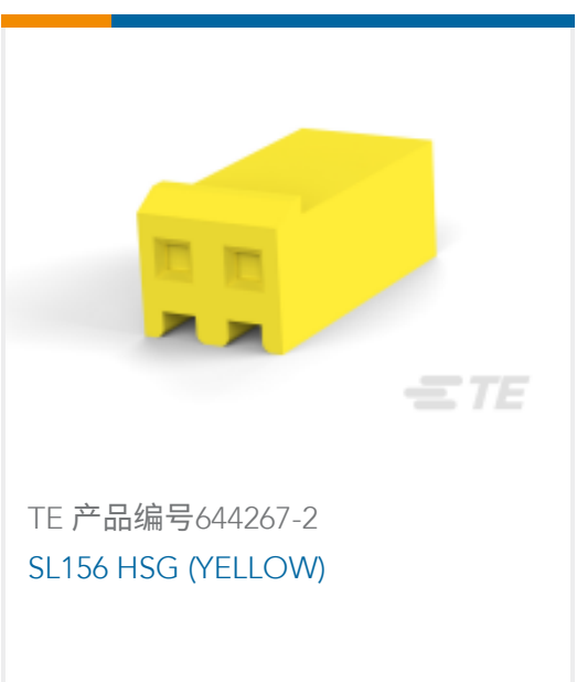
TE 产品编号644267-2 SL156 HSG (YELLOW)