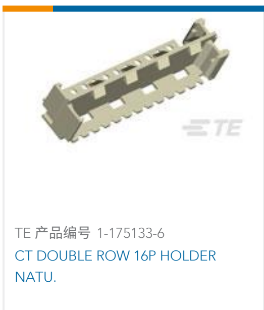
TE 产品编号 1-175133-6 CT DOUBLE ROW 16P HOLDER NATU.