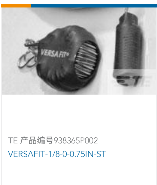
TE 产品编号938365P002 VERSAFIT-1/8-0-0.75IN-ST