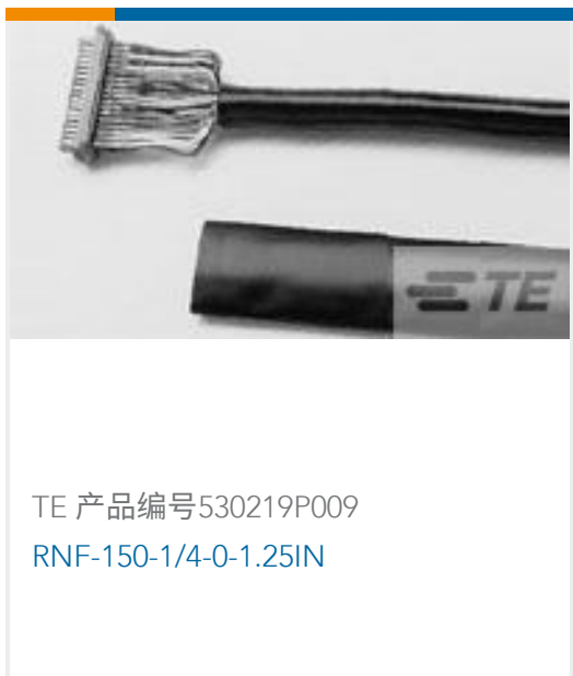
TE 产品编号530219P009 RNF-150-1/4-0-1.25IN