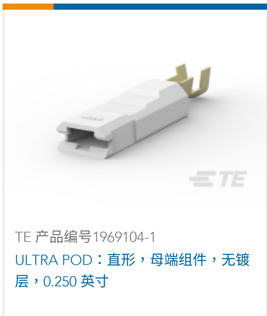
TE 产品编号1969104-1 ULTRA POD: 直形, 母端组件, 无镀层, 0.250 英寸