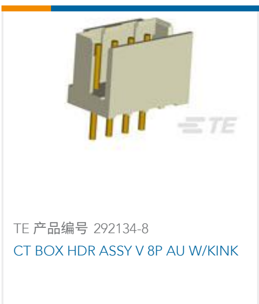
TE 产品编号 292134-8 CT BOX HDR ASSY V 8P AU W/KINK