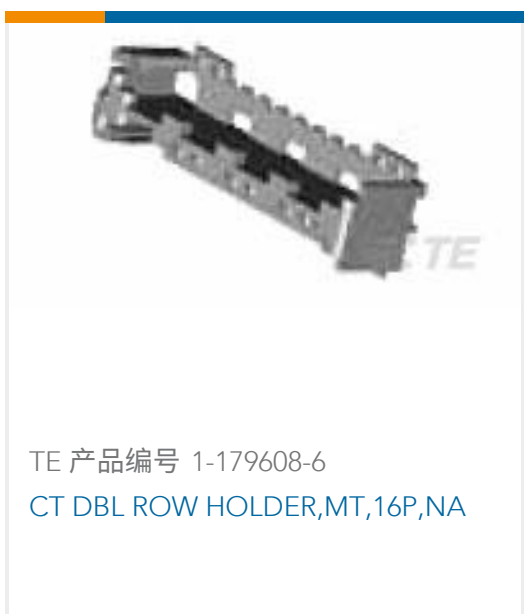
TE 产品编号 1-179608-6 CT DBL ROW HOLDER,MT,16P,NA