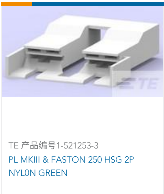
TE 产品编号1-521253-3 PL MKIII & FASTON 250 HSG 2P NYLON GREEN