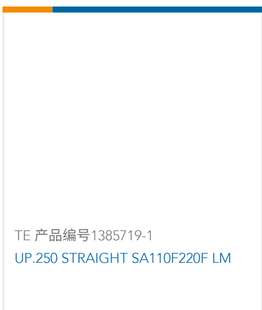
TE 产品编号1385719-1 UP.250 STRAIGHT SA110F220F LM