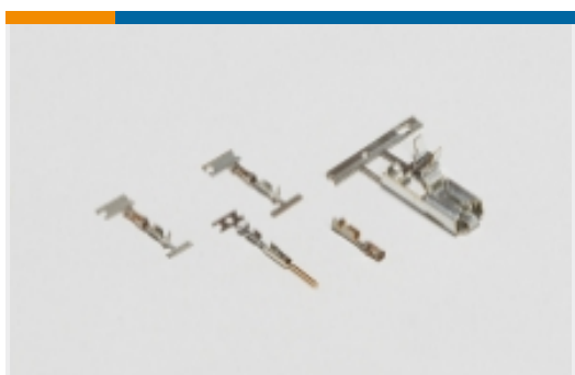
线对板连接器端子(8)