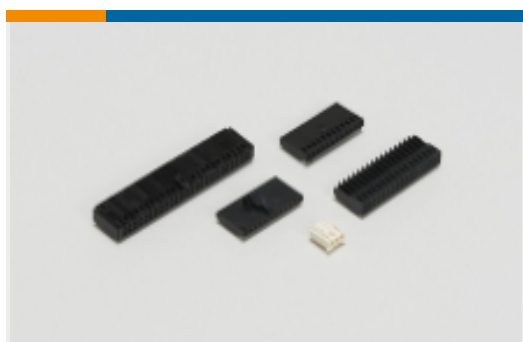
线对板连接器壳体(226)