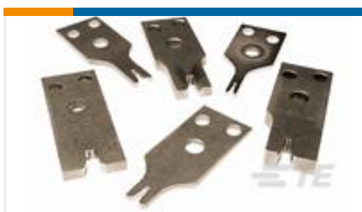
TE 产品编号1-1633962-1 CRIMPER, INSULATION F PREMIUM