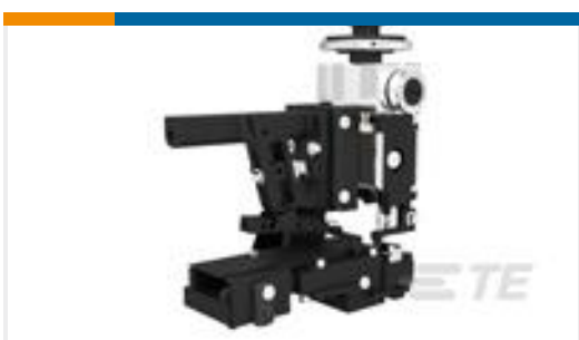
TE 产品编号2151076-1 OCEAN_2_0_APPLICATOR-S-042F057F-RSM