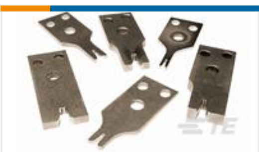
TE 产品编号6-1633961-6 CRIMPER, INSULATION F PREMIUM