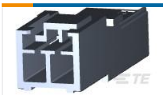
TE 产品编号176282-9 AMP UNIVERSAL POWER CAP 2P