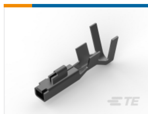
TE 产品编号 175156-2 U/P REC CONT L/P