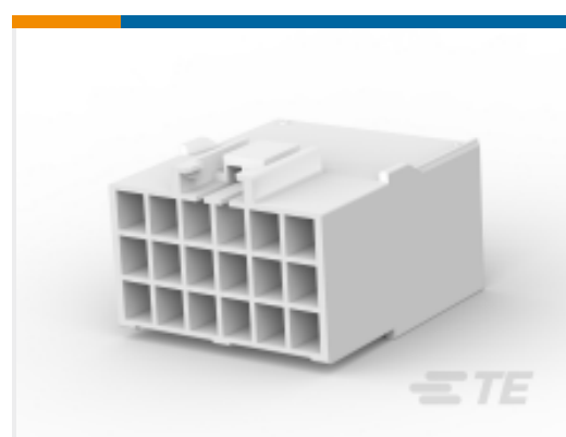
TE 产品编号 176291-1 UNIV POWER CAP HSG 18P F/H