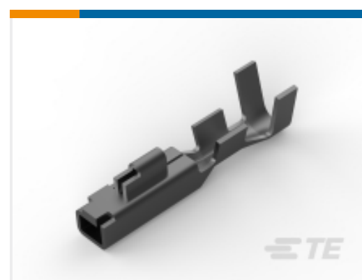
TE 产品编号 175155-1 UNIV POWER REC CONT L/P