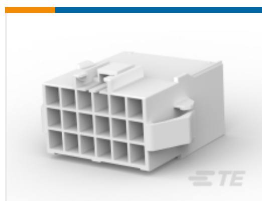
TE 产品编号 176301-1 UNVI POWER CAP HSG 18P PNL MTG