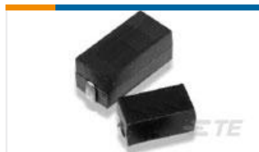
TE 产品编号4-1676966-7 SMW2 8R2 5%