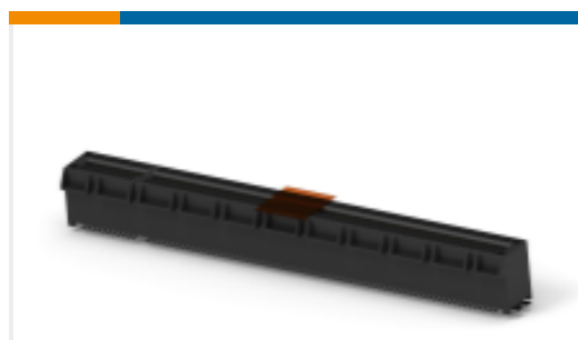
TE 产品编号 5-2337939-4 PCIE GEN4 CON,SMT,164POS,30u", MYLAR,HT