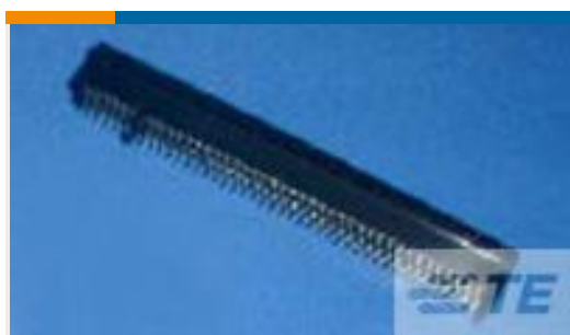
TE 产品编号 1734774-1 PCI EXP 3.1L 36 POS WHT G/F