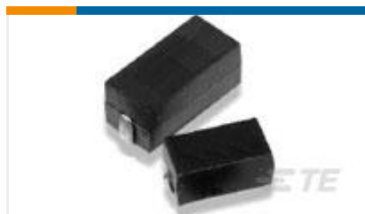
TE 产品编号4-1879021-1 SMW3 4R7 5%