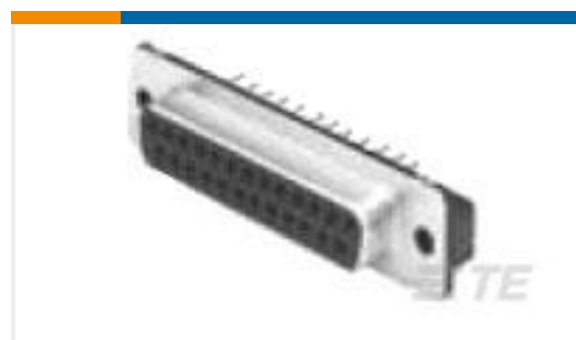
TE 产品编号5745967-8 25 RCPT SP/FMS INSRT