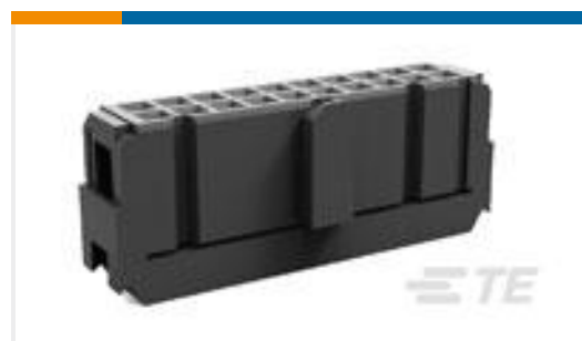
TE 产品编号1-1658621-2 64 NOVO MIL/CTR 15DP,LEAD FREE