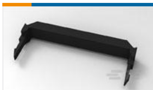
TE 产品编号1-499252-3 064 STRAIN RELIEF A-L RCPT