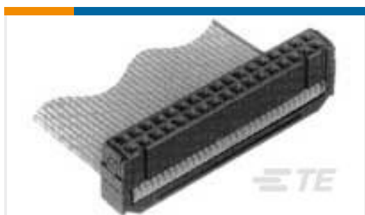
TE 产品编号1658623-1 10 NOVO MIL 30DP, LEAD FREE