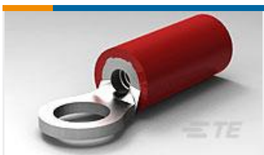
TE 产品编号32945 PG R 22-16 COMM 22-18 MIL 6