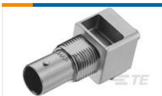
TE 产品编号5227433-1 BNC PCB JACK BLKHD ASSY