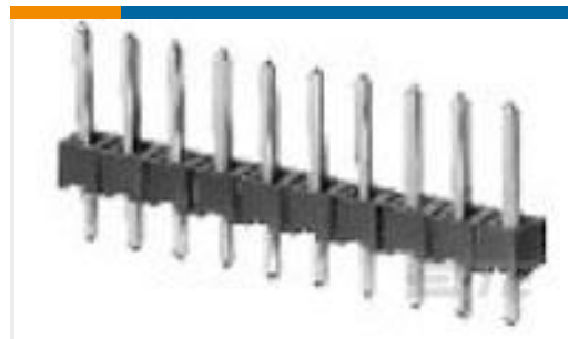
TE 产品编号6-146280-0 10 MODII HDR SRST B/A .100CL