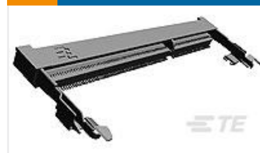
TE 产品编号2-2013290-1 EMBOSS TAPE DDR3 204P 5.2H RVS