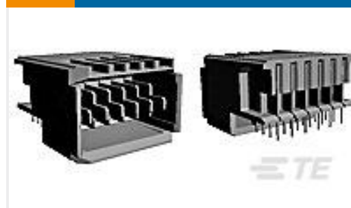
TE 产品编号120958-1 UPM EXPANDED PIN ASSEMBLY