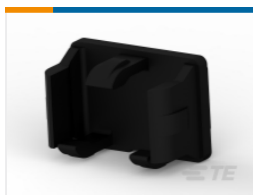
TE 产品编号 1367147-1 SFP COVER, UNPLATED