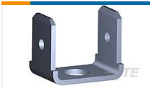
TE 产品编号60080-2 250 FASTON TAB TPBR