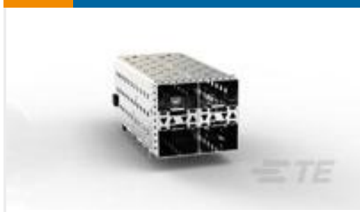
TE 产品编号2007637-5 SFP+ assy 2x2 Spring Fingers 4 LP Sn