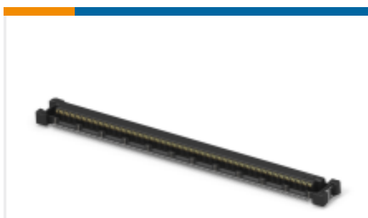
TE 产品编号2357739-1 16G,05FH,REC,220PIN,4H,Hard Tray