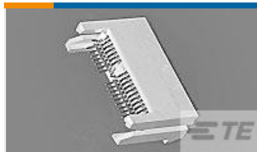
TE 产品编号5-1734857-5 PCI EXP STRADDLE 36P BLK 30u"