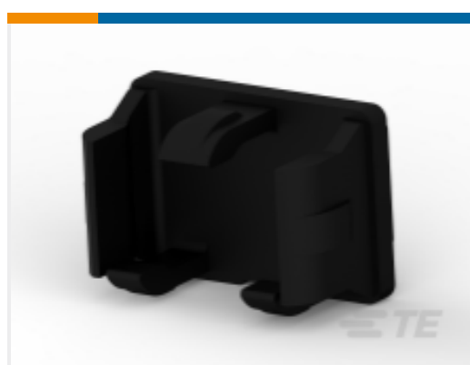
TE 产品编号 1367147-3 SFP COVER, UNPL, NO LOGO