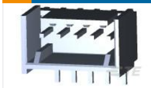
TE 产品编号2-644803-5 05P MTA100 SHRD HDR ASST RA FL