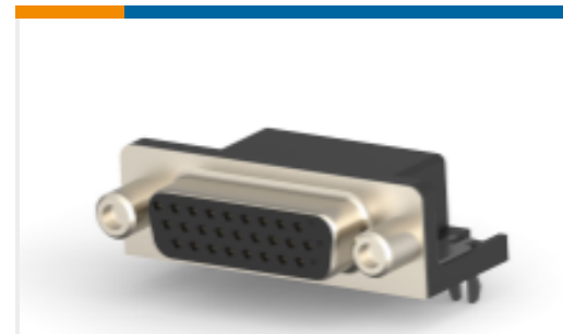
TE 产品编号2311768-1 AMPL REC, HD22, R/A, 26P, THREADED