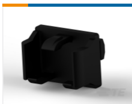
TE 产品编号 1761394-1 DUST COVER, SFP, GANGED & STACKED