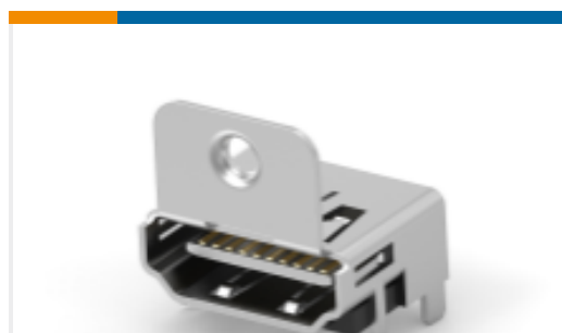
TE 产品编号8-1747981-2 Std HDMI, RA, SMT, Panel grd, Flange