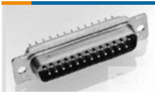
TE 产品编号 1757823-1 AMPLIMITE,ASY,PLUG,STD,90,ZN,1