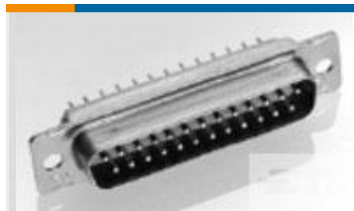
TE 产品编号 1757823-3 AMPLIMITE,ASY,PLUG,STD,90,ZN,3