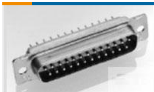
TE 产品编号 1757824-3 AMPLIMITE,ASY,RCPT,STD,90,ZN,3