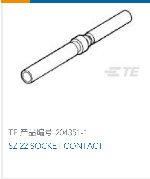
TE 产品编号 204351-1 SZ 22 SOCKET CONTACT