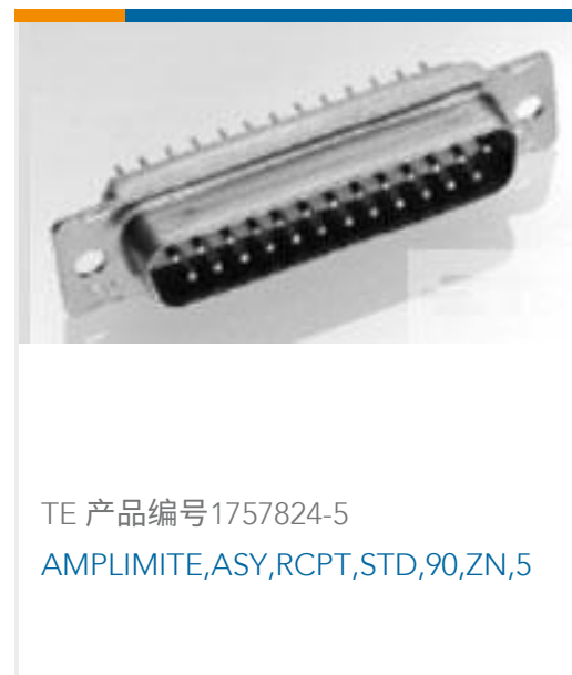
TE 产品编号1757824-5 AMPLIMITE,ASY,RCPT,STD,90,ZN,5