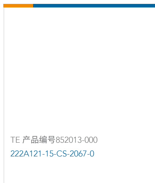
TE 产品编号852013-000 222A121-15-CS-2067-0