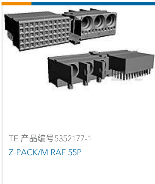
TE 产品编号5352177-1 Z-PACK/M RAF 55P