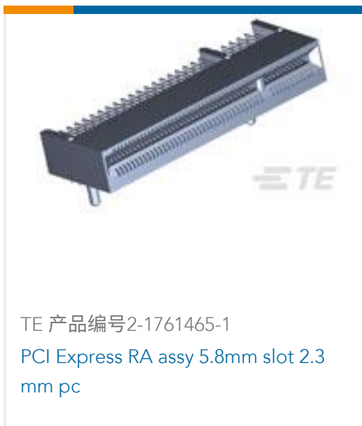
TE 产品编号2-1761465-1 PCI Express RA assy 5.8mm slot 2.3 mm pc