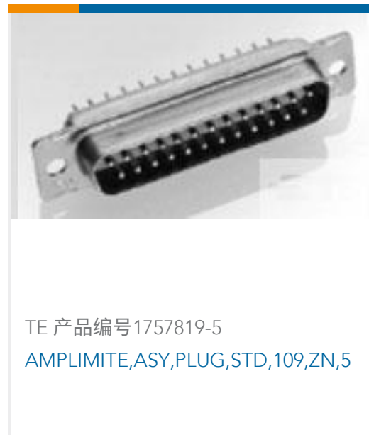
TE 产品编号1757819-5 AMPLIMITE,ASY,PLUG,STD,109,ZN,5