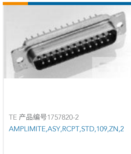
TE 产品编号1757820-2 AMPLIMITE,ASY,RCPT,STD,109,ZN,2