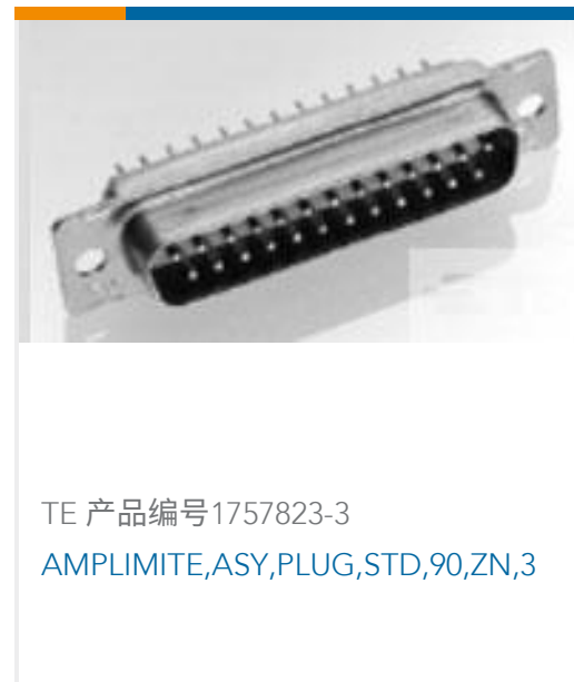
TE 产品编号1757823-3 AMPLIMITE,ASY,PLUG,STD,90,ZN,3