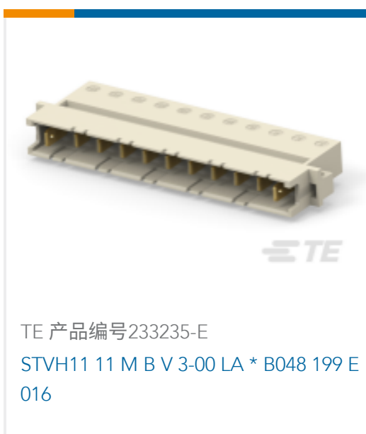
TE 产品编号233235-E STVH11 11 M B V 3-00 LA * B048 199 E 016