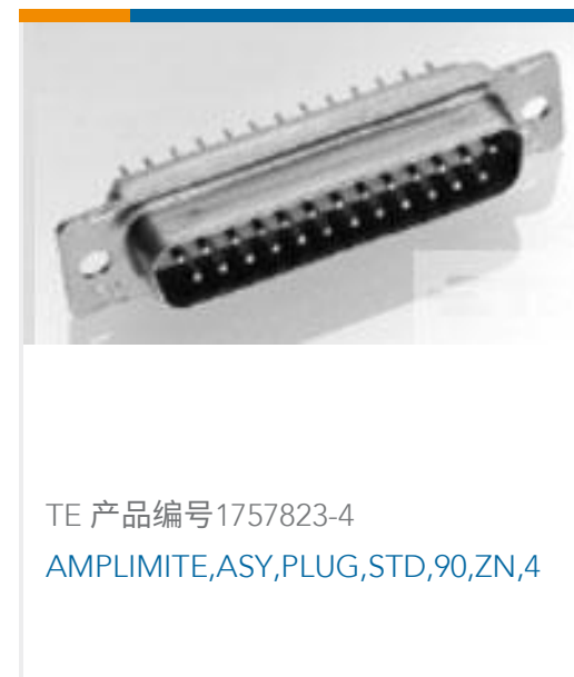
TE 产品编号1757823-4 AMPLIMITE,ASY,PLUG,STD,90,ZN,4