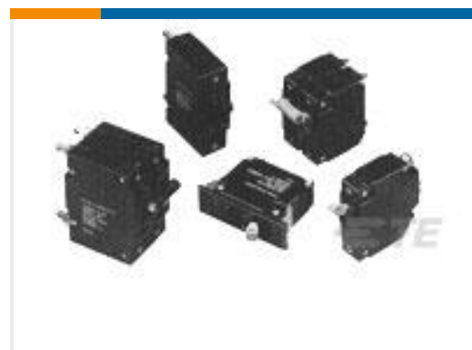
TE 产品编号4-1393254-7 W91-X152-35=M6/M7/M9/W6/W7