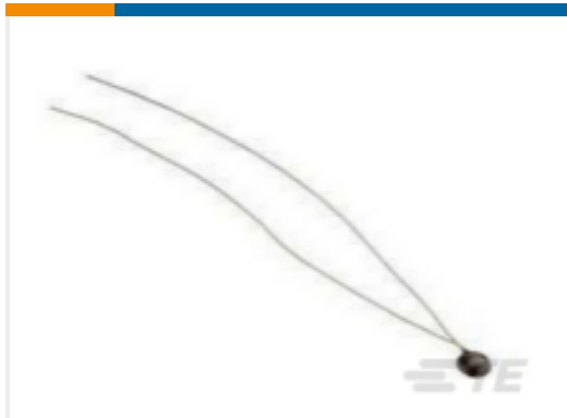
TE 产品编号11029759-00 44909 THERM GSFC 311P18-09S7R6