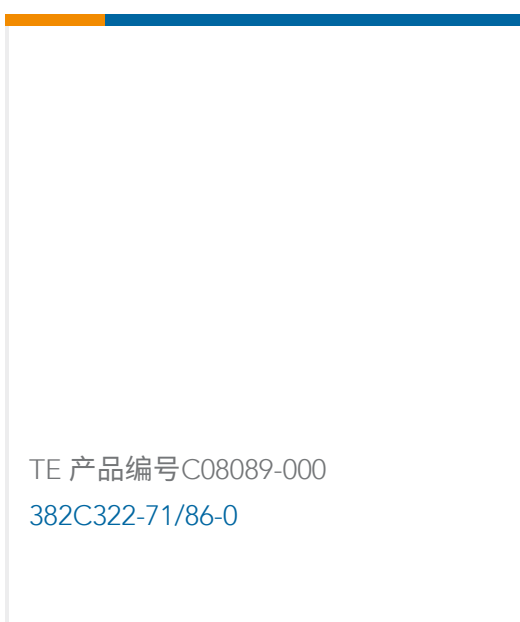
TE 产品编号C08089-000 382C322-71/86-0