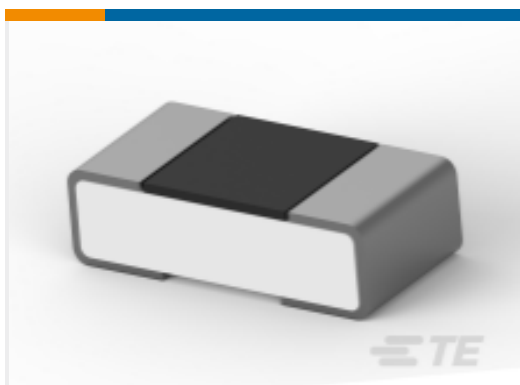
TE 产品编号7-2176362-1 RQ 0402 215R 0.1% 10PPM 5K RL