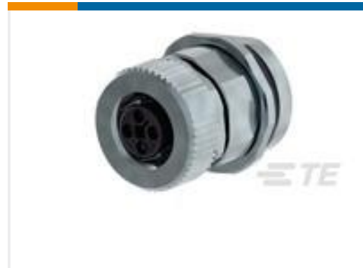
TE 产品编号2120946-1 M12 DC POWER SOCKET CONNECTOR, T-CODED