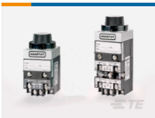
TE 产品编号 1-1423159-9 7012PB=RLY,STD,ON,2P,125VDC, 5