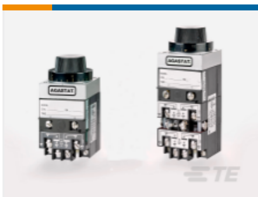
TE 产品编号 2-1423159-3 7012PC=RLY,STD,ON,2P,125VDC,15