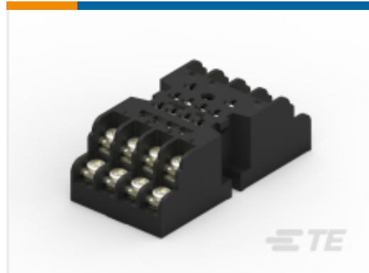
TE 产品编号1-1393143-9 27E166=SOCKET,KH,14,SCW,PLES