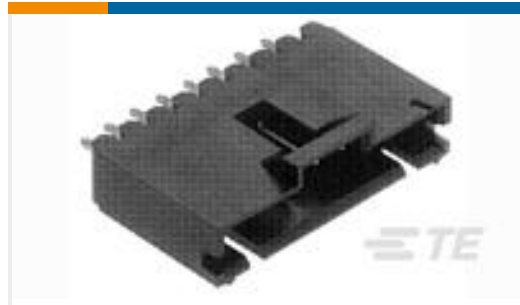
TE 产品编号5-103908-2 03 MTE HDR SRST LATCH W/HLDWN