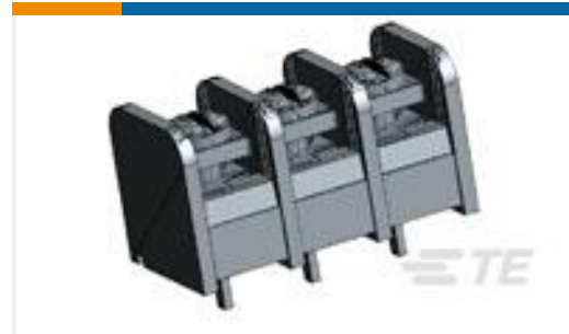
TE 产品编号3-1437664-1 NC6-P108-03=NC6 ASSEMBLY