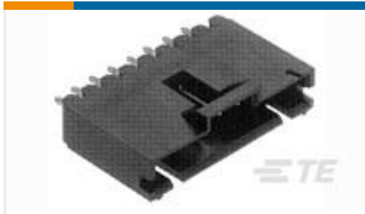
TE 产品编号5-103908-1 02 MTE HDR SRST LATCH W/HLDWN