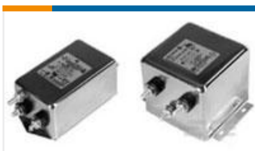
TE 产品编号1-6609036-6 40VSK6=F7775 S0