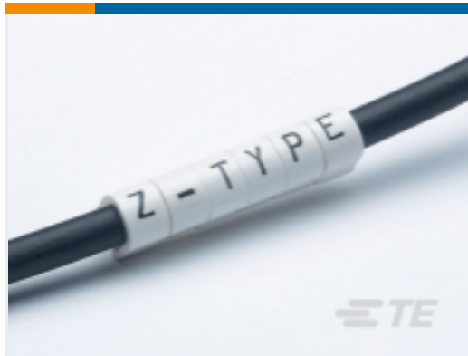
TE 产品编号 EC0437-000 06153411