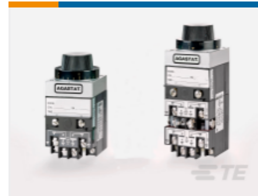
TE 产品编号 1755170-1 7022OCIM=RLY, STD, OFF, 2P, 24V, 15S, I, M