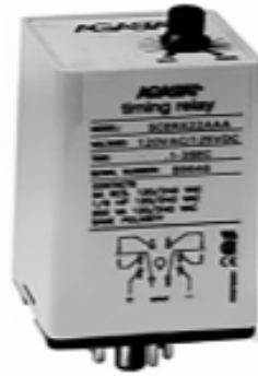
TE 产品编号 2-1437463-1 SCERX22ABA=120V & 125VDC 0.5 TO