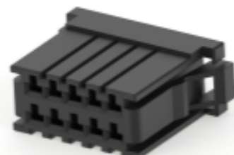
TE 产品编号 CAT-D9934-A75A Dynamic 3100 母端和公端壳体