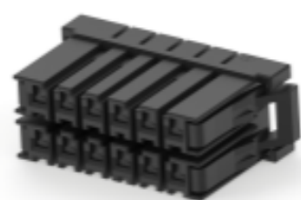
TE 产品编号 CAT-D9934-A75B Receptacle and Tab Housing: 5.08 mm Pitch, 250-600V