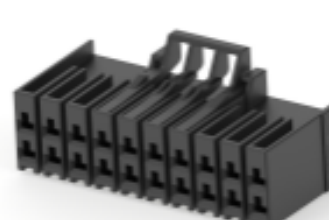
TE 产品编号 CAT-D9934-A75C Dynamic 3500 母端和公端壳体