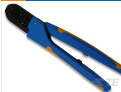
TE 产品编号 91565-1 CCII D-3 S REC TAB 28-24 ASSY