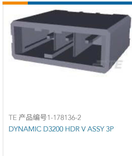
TE 产品编号1-178136-2 DYNAMIC D3200 HDR V ASSY 3P