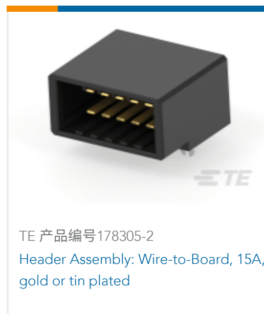
TE 产品编号178305-2 Header Assembly: Wire-to-Board, 15A, gold or tin plated