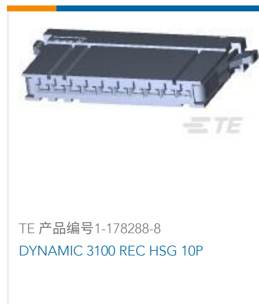
TE 产品编号1-178288-8 DYNAMIC 3100 REC HSG 10P