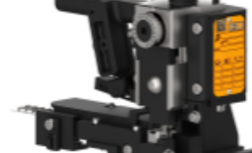
TE 产品编号 2151080-1 OCEAN_2.0_APPLICATOR-S-062F110F-RSM