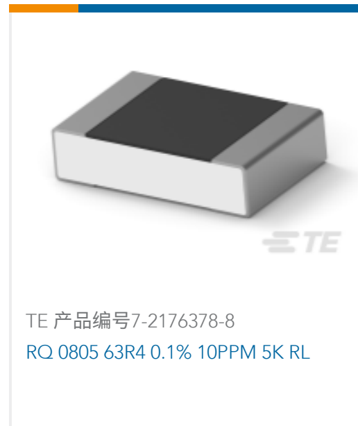
TE 产品编号7-2176378-8 RQ 0805 63R4 0.1% 10PPM 5K RL