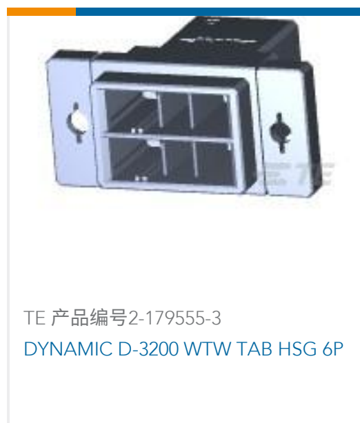
TE 产品编号2-179555-3 DYNAMIC D-3200 WTW TAB HSG 6P