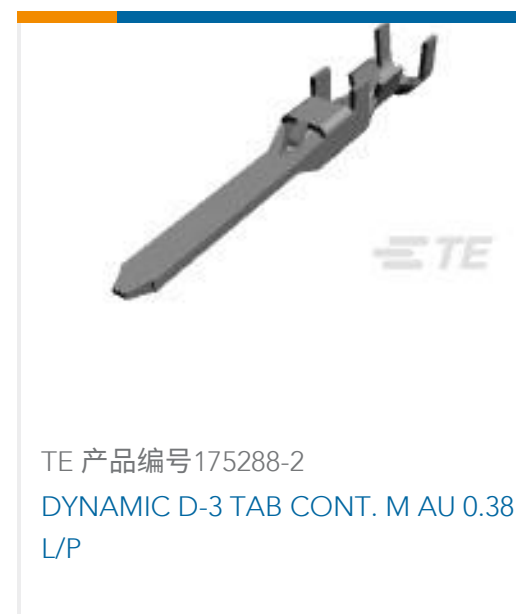
TE 产品编号175288-2 DYNAMIC D-3 TAB CONT. M AU 0.38 L/P