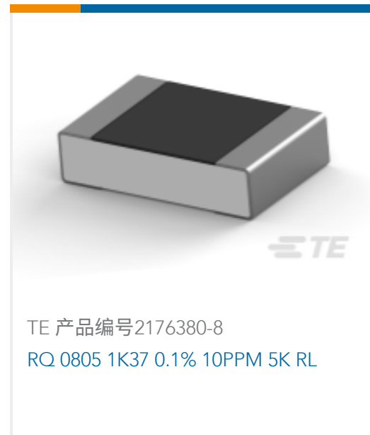
TE 产品编号2176380-8 RQ 0805 1K37 0.1% 10PPM 5K RL