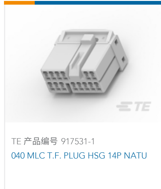
TE 产品编号 917531-1 040 MLC T.F. PLUG HSG 14P NATU