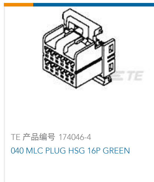
TE 产品编号 174046-4 040 MLC PLUG HSG 16P GREEN