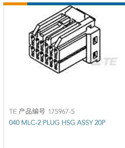
TE 产品编号 175967-5 040 MLC-2 PLUG HSG ASSY 20P