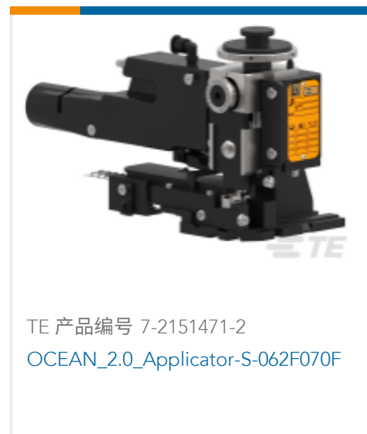
TE 产品编号 7-2151471-2 OCEAN_2.0_Applicator-S-062F070F