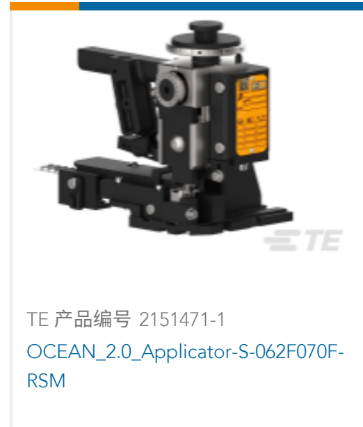
TE 产品编号 2151471-1 OCEAN_2.0_Applicator-S-062F070F-RSM