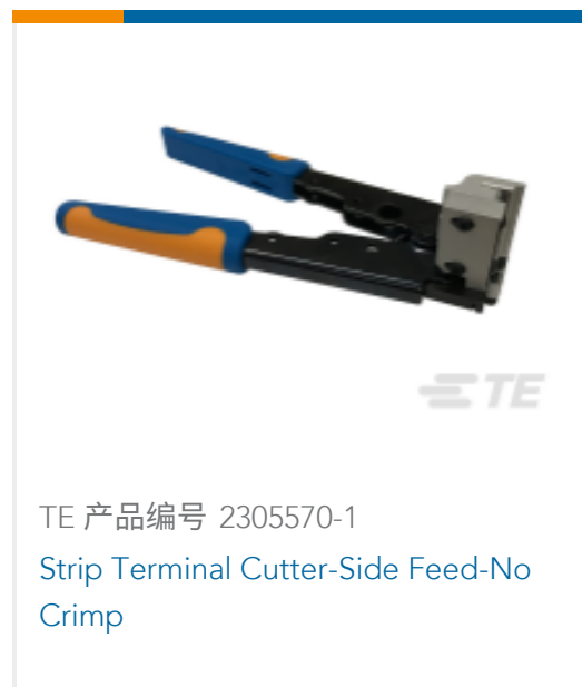
TE 产品编号 2305570-1 Strip Terminal Cutter-Side Feed-No Crimp