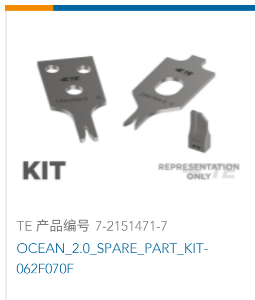
TE 产品编号 7-2151471-7 OCEAN_2.0_SPARE_PART_KIT-062F070F