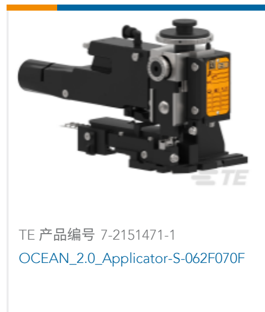
TE 产品编号 7-2151471-1 OCEAN_2.0_Applicator-S-062F070F