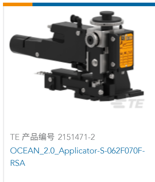
TE 产品编号 2151471-2 OCEAN_2.0_Applicator-S-062F070F-RSA