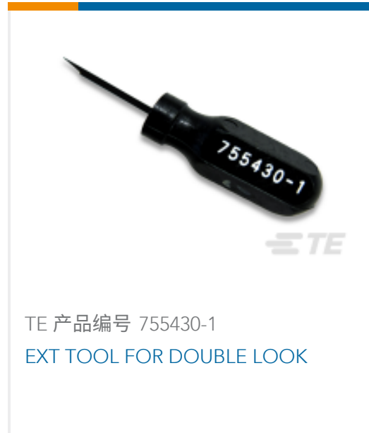
TE 产品编号 755430-1 EXT TOOL FOR DOUBLE LOOK