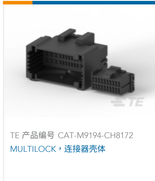
TE 产品编号 CAT-M9194-CH8172 MULTILOCK, 连接器壳体