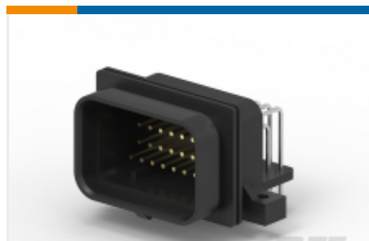
TE 产品编号2-6437285-6 SUPER SEAL 34POS CAP ASSY H AU