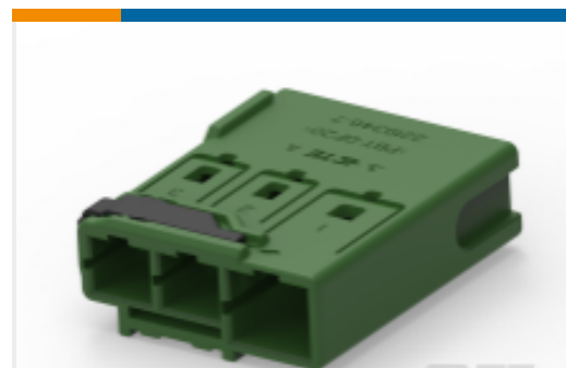
TE 产品编号2219346-7 RF S/L HYB 3P PLUG ASSY GRN KEYCODE A