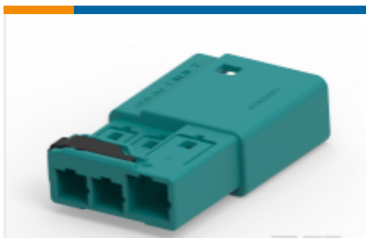
TE 产品编号1-2219343-8 RF S/L HYB 3P CAP ASSY BLU