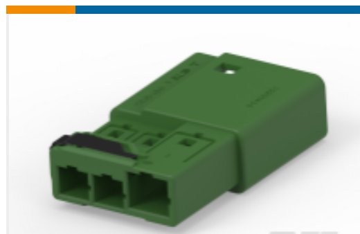
TE 产品编号2219343-7 RF S/L HYB 3P CAP ASSY GRN