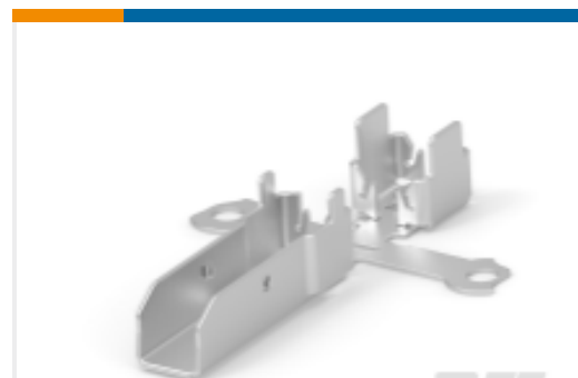
TE 产品编号1-1897798-3 TAB SHIELD CONT-RF STRIPLINE