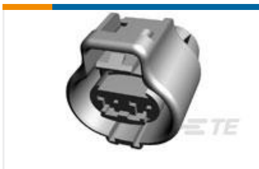
TE 产品编号176146-2 187 PLUG HSG 2P BLACK