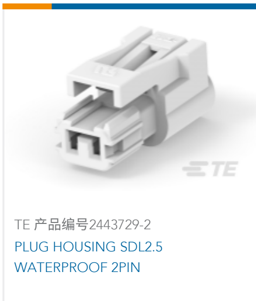
TE 产品编号2443729-2 PLUG HOUSING SDL2.5 WATERPROOF 2PIN