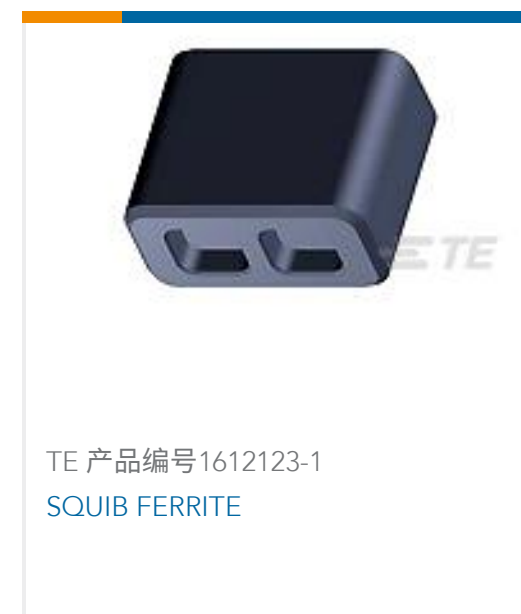
TE 产品编号1612123-1 SQUIB FERRITE