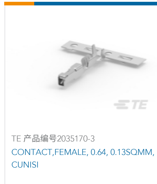
TE 产品编号2035170-3 CONTACT, FEMALE, 0.64, 0.13SQMM, CUNISI