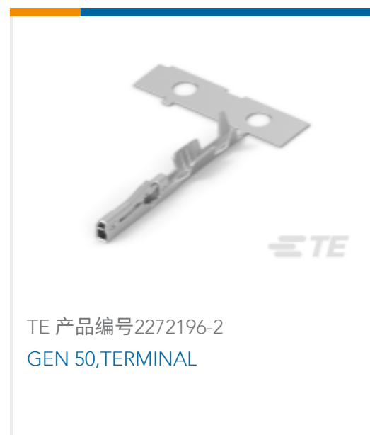
TE 产品编号2272196-2 GEN 50, TERMINAL