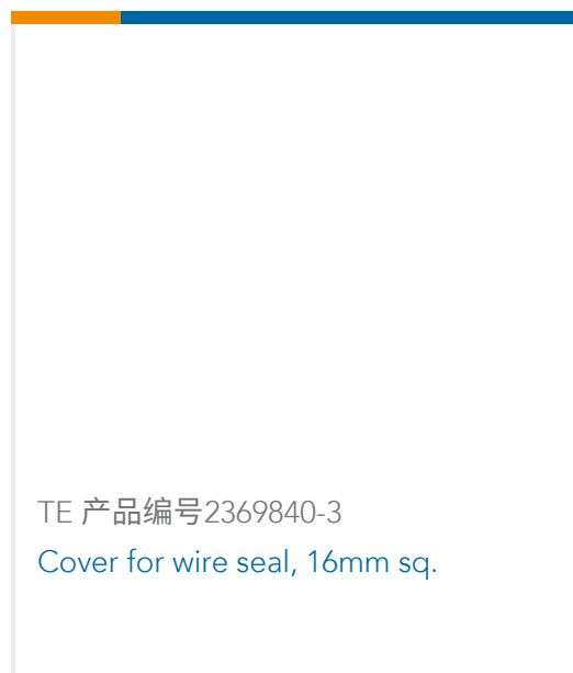
TE 产品编号2369840-3 Cover for wire seal, 16mm sq.