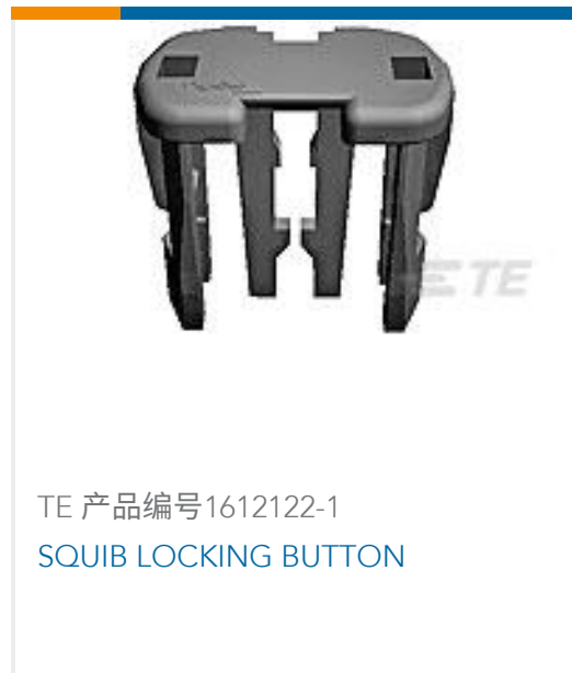
TE 产品编号1612122-1 SQUIB LOCKING BUTTON