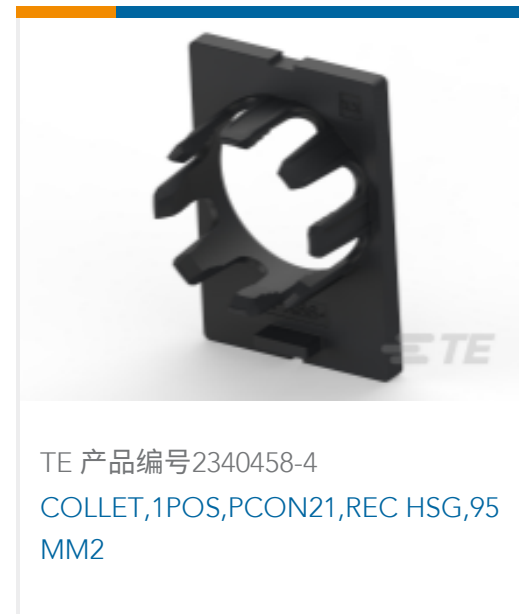
TE 产品编号2340458-4 COLLET, 1POS, PCON21, REC HSG, 95 MM2