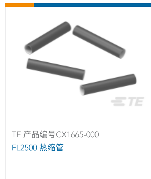
TE 产品编号CX1665-000 FL2500 热缩管