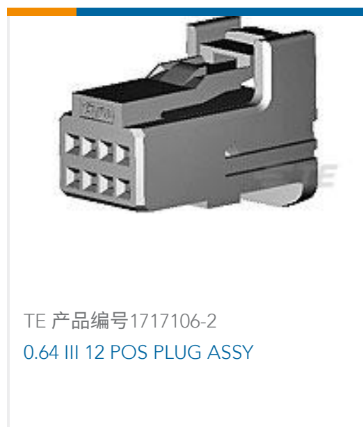
TE 产品编号1717106-2 0.64 III 12 POS PLUG ASSY