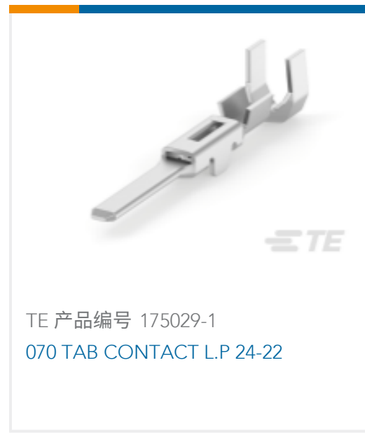
TE 产品编号 175029-1 070 TAB CONTACT L.P 24-22