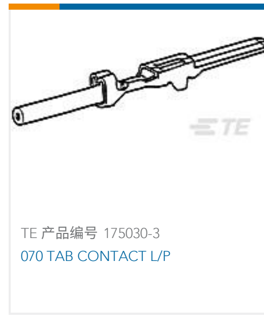
TE 产品编号 175030-3 070 TAB CONTACT L/P