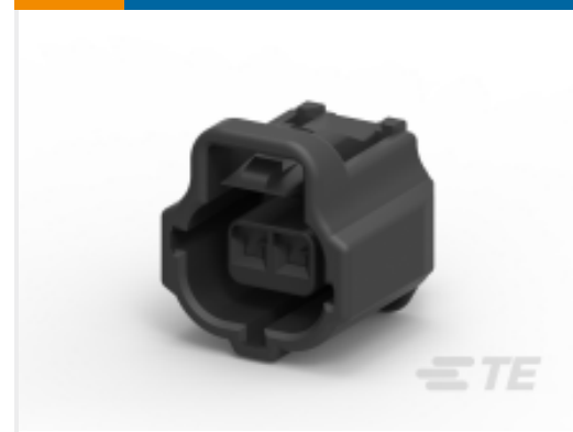
TE 产品编号 2822361-1 070 SENSOR PLUG ASSY 2P BLACK