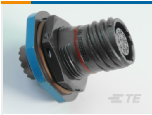
TE 产品编号 YDTS24F23-21SAV001 RECP ASSY