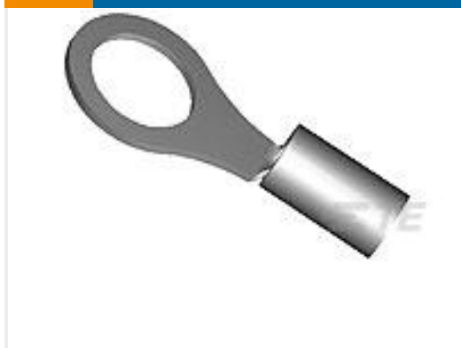
TE 产品编号 8-55859-3 12-10 PRE-INSUL SEALED TERM R