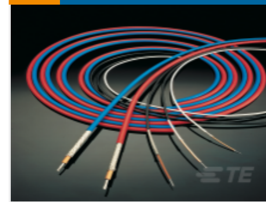
TE 产品编号 EG4699-000 7522B7331-0