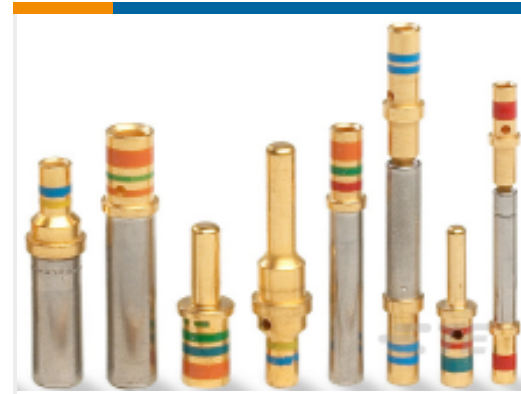
TE 产品编号 1962-203-0831 CONT SOC ASSY