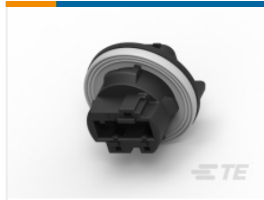
TE 产品编号 2-2109118-2 BULB ASSY FOR T20/T2 BK EXT