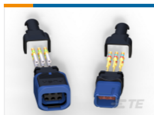
TE 产品编号YD369-R66-AP000000 369 6 WAY REC, NO CONTACTS, PIN