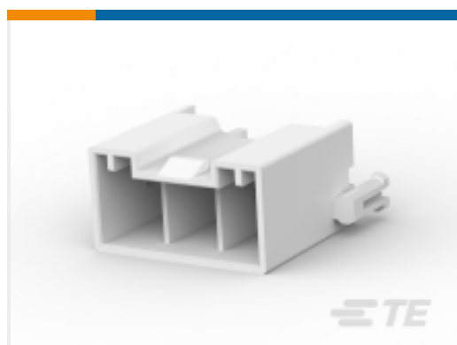
TE 产品编号 1747996-1 GHC EYELET 12.4 2POS HEADER ASSY NATURAL