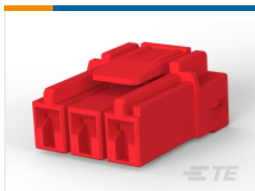
TE 产品编号 1747995-2 GHC EYELET 6.2 3POS PLUG HOUSING RED