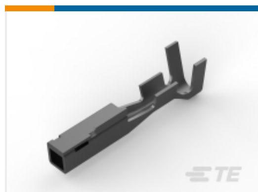
TE 产品编号 CAT-G7534-R2435 Grace Inertia 母端