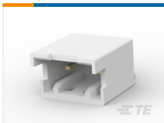
TE 产品编号 1747508-1 GRACE INERTIA CONN 2.5 HDR ASSY 2/3P NAT