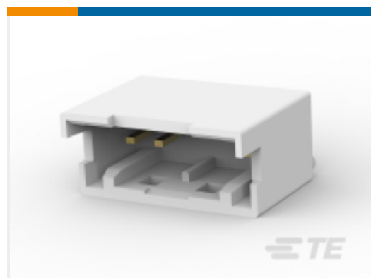
TE 产品编号 1827738-1 GIC 2.5 HDR ASSY SPECIAL 3/5P