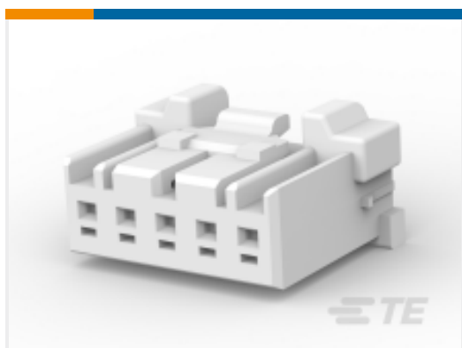
TE 产品编号 1747066-5 GRACE INERTIA CONN 2.5 PLUG HSG 5P NATUR