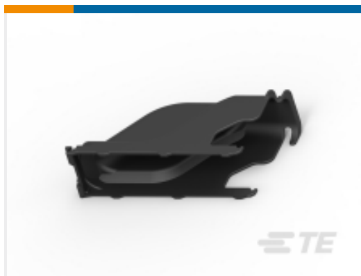
TE 产品编号1746816-1 0.64/2.3II SEALED CONNECTOR 126POS WIRE