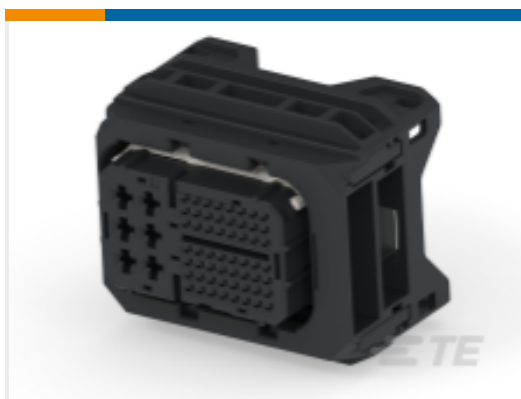
TE 产品编号2260813-2 0.5/2.8 SEALED PLUG ASSY 62POS