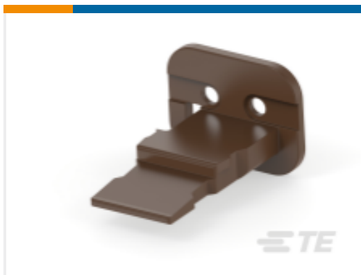
TE 产品编号W2SD WEDGE LOCK, 2P, PLG, BRN, STD, DT, D