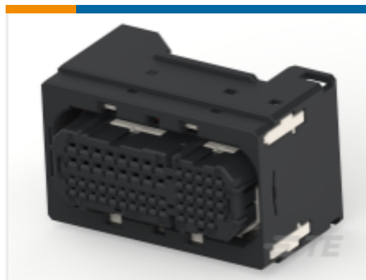
TE 产品编号1939938-1 0.50/1.0 SEALED PLUG ASSY 60POS