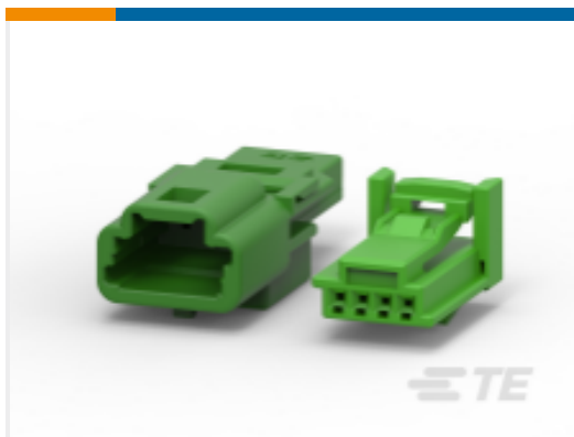
TE 产品编号1612283-1 TH/.025 连接器系统 · 壳体