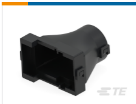
TE 产品编号936614-2 HYBRID 42P CAP COVER HSG