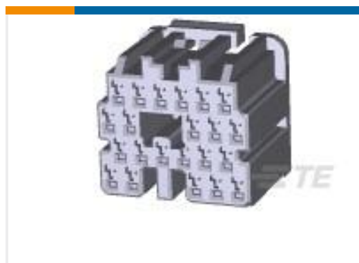
TE 产品编号316016-1 040 PAIR MATE PLUG HSG ASY 22P