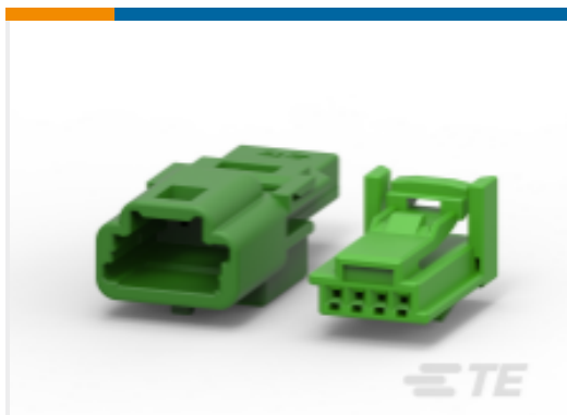
TE 产品编号1981471-1 TH/.025 连接器系统, 壳体