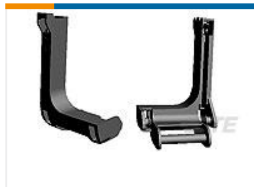
TE 产品编号1747139-1 SEALED EFI ECU 126POS LEVER R