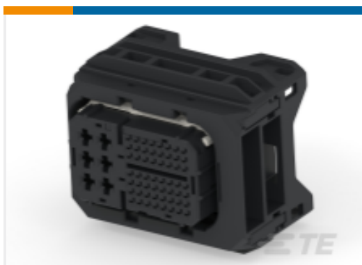
TE 产品编号2260813-2 0.5/2.8 SEALED PLUG ASSY 62POS