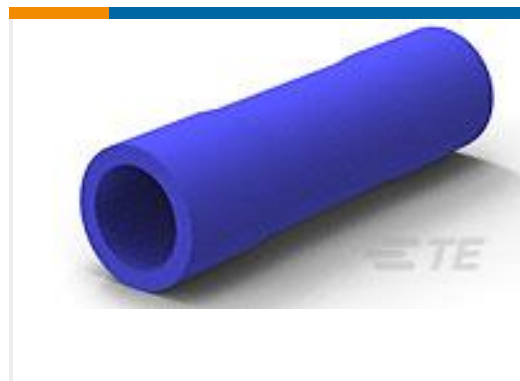
TE 产品编号34133 SPLICE, PG PARA 16-14