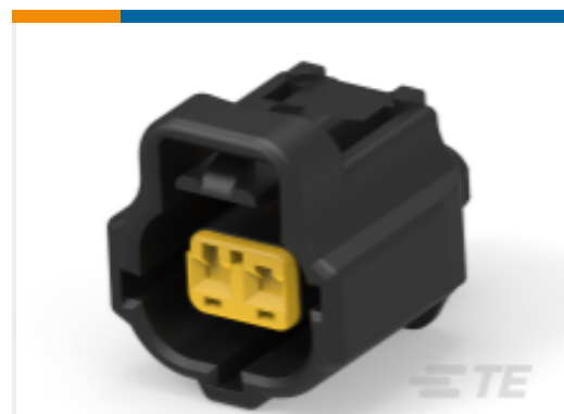
TE 产品编号2260930-2 EJ-2 DBL LOCK PLUG ASSY 2P