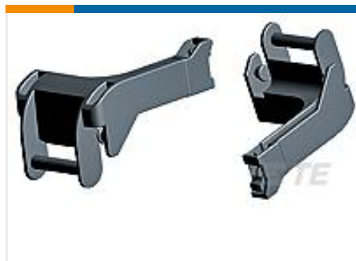
TE 产品编号1612288-1 SEALED 0.64/2.3II 60POS LEVER