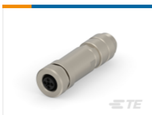
TE 产品编号3-2172097-2 M12 FEMALE CABLE CONNECTOR-T- CODING-SHLD