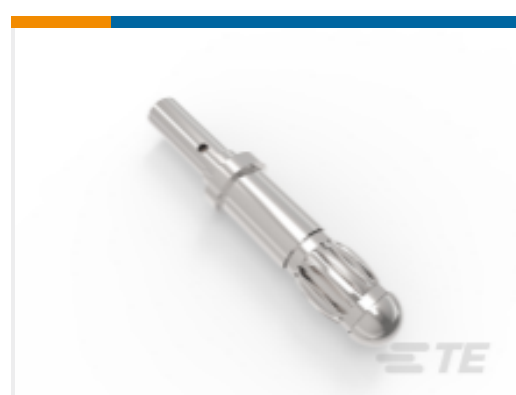
TE 产品编号YS-UC-212124A-0000 CONTACTS KIT FOR RECEPTACLE