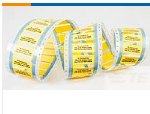
TE 产品编号0173830001 TMS-SCE-1K-1/8-2.0-S2-4