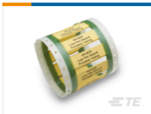
TE 产品编号F83400-000 HX-SCE-19.0-50-S1-4