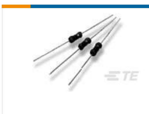
TE 产品编号1-1879351-1 RR01 5% 7K5 AMMO