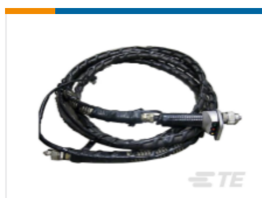
TE 产品编号1901777-1 HYP10 21FT HAND CTRL