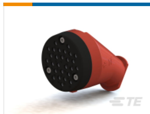
TE 产品编号YE-UC-212095A-0000 PLUG, COMMUNICATION COMMUTER