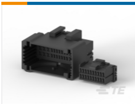
TE 产品编号282994-2 MULTILOCK, 连接器壳体