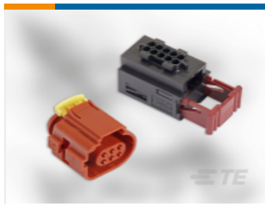
TE 产品编号1-967623-3 Timer Connector Housing