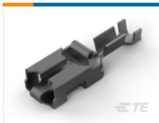
TE 产品编号282167-3 POS.LOCK RCPT CONT