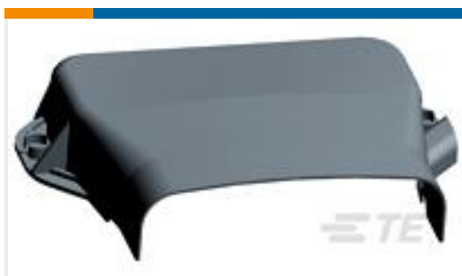
TE 产品编号284371-1 COVER FOR PLATE