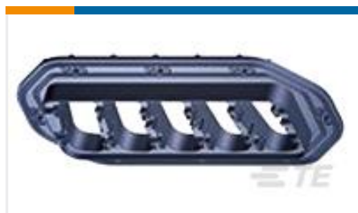
TE 产品编号284581-1 SUPPORT PLATE ASSEMBLY