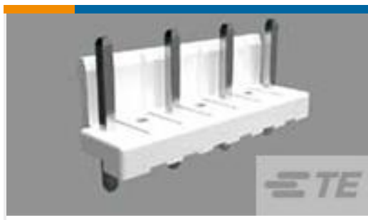
TE 产品编号7-1123724-2 03P EP HDR HSG V0 GWT NO 02P