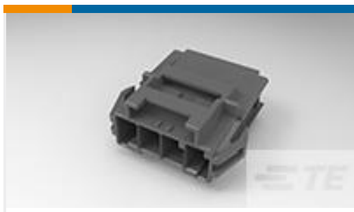
TE 产品编号5-2232263-4 PTL 1X4 CAP PANEL MT GLW WIRE KEY A DGR