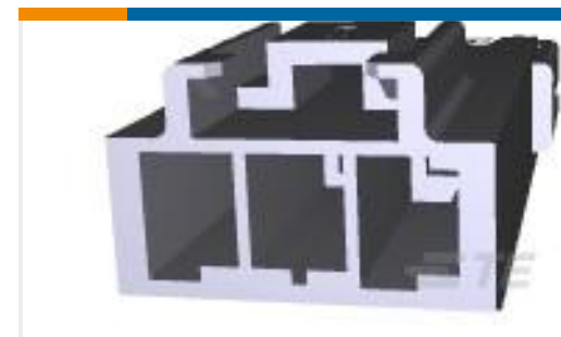
TE 产品编号368572-1 PDL 3P CAP 3.96 F/H(GWT) NAT