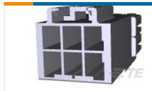
TE 产品编号2005253-1 PDL 6P CAP 3.96 D/R F/H(GWT) N