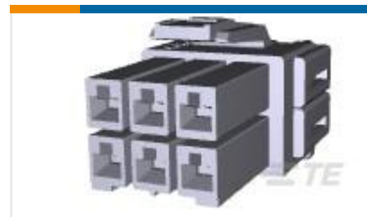
TE 产品编号368576-1 PDL 6P PLUG 3.96 D/R(GWT) NAT