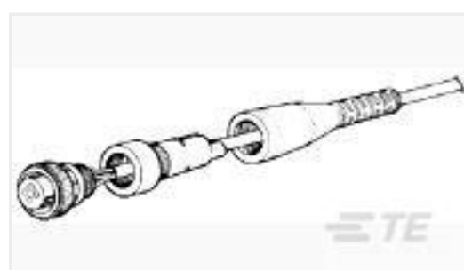
TE 产品编号207489-1 FLEXIBLE CABLE BOOT, SIZE 11