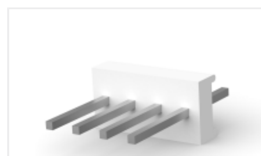
TE 产品编号CAT-104MTA-PVUNH PCB Header: Polyester, Vertical, Unshrouded, No Mating Alignment