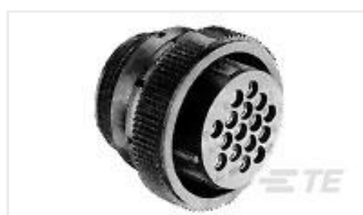
TE 产品编号183039-1 SIZE 17-14 CPC PLUG ASS'YSTD S