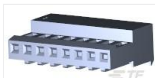
TE 产品编号3-640440-8 08P MTA100 CONN ASSY 22AWG RED