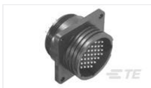
TE 产品编号1-207303-5 CPC RECPT ASSM SIZE 17-16