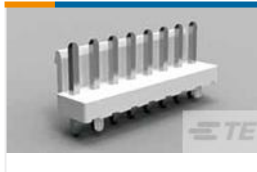
TE 产品编号1-1744429-0 3.96 EP HDR ASSY 10P W/PEGS, GW