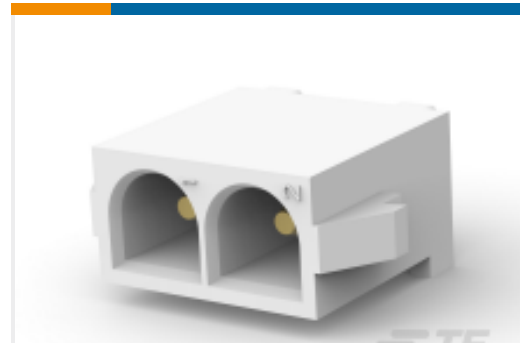
TE 产品编号1969798-1 02P UMNL PIN HDR ASSY NATL, PIN V0 GW