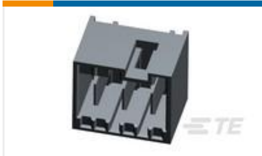
TE 产品编号6-1971845-3 3P, RAST 5 Tab Header, THV