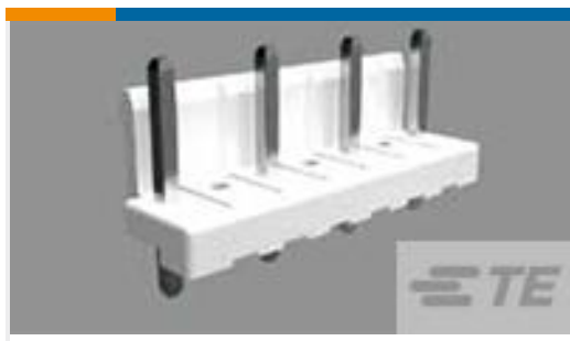
TE 产品编号3-1123724-4 3.96EP HDR ASSY 4(7)P BLUE