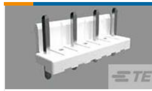
TE 产品编号6-1123724-4 3.96EP HDR ASSY 4(7)P GREEN