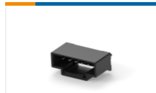
TE 产品编号6-1971798-5 NEW GI CONN2.5 HDR ASMBLY 6P BLK D1.0