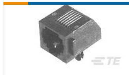
TE 产品编号5555165-1 M/J, LPF, R/A, 6P/6C, TIN, BUL