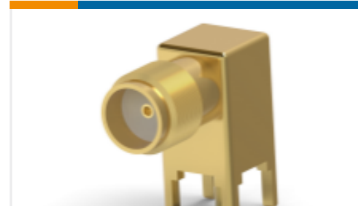
TE 产品编号5-1814400-2 SMA R/A PCB Skt GZD