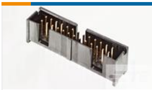
TE 产品编号5103308-5 A/L LOW PRO HDR 20P VERT BLACK