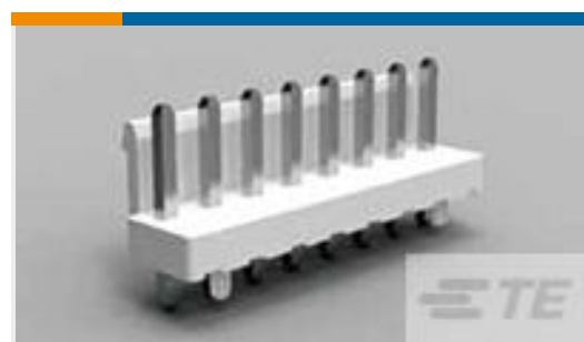
TE 产品编号 4-1744057-5 3.96 EP HDR ASSY 5P W/PEGS,YEL