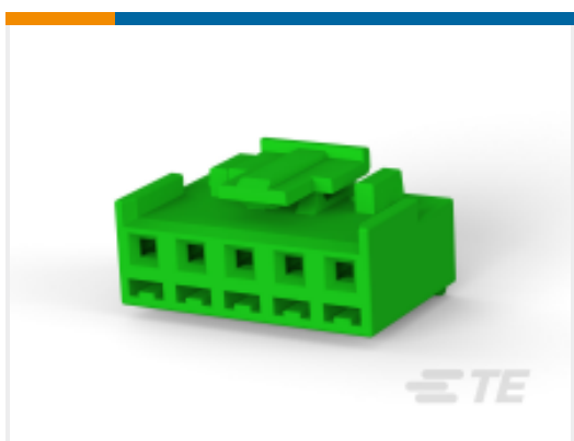
TE 产品编号 1744495-5 05P EP-II HOUSING, GREEN