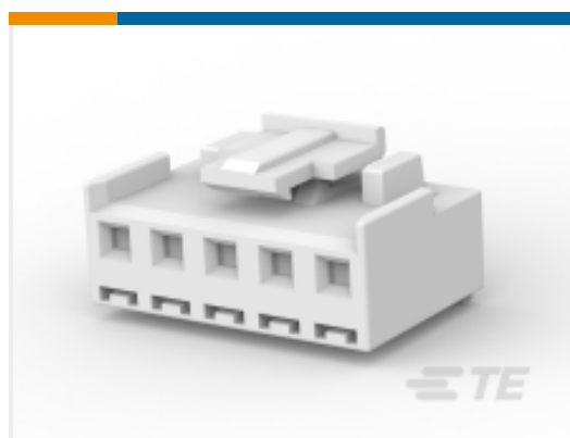
TE 产品编号 1744416-5 5 POS EP II HSG, GLOW WIRE