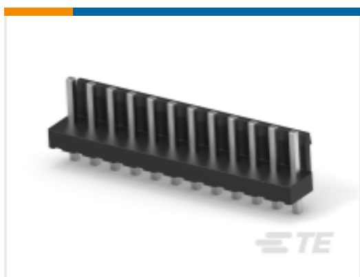
TE 产品编号 1-1744055-2 3.96 EP HDR ASSY 12P VERT HT