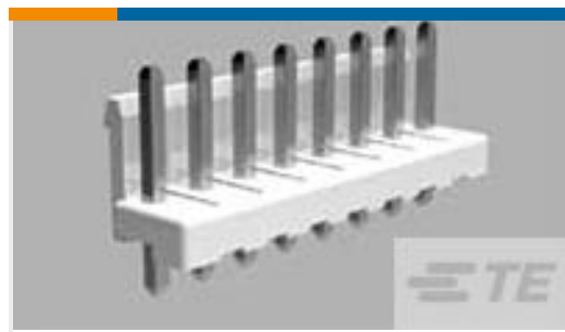
TE 产品编号2-1123723-2 3.96 EP HDR ASSY 2P(YELLOW)