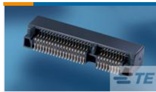
TE 产品编号1775838-2 mSATA/mini PCI-E 5.6H Type I G/F