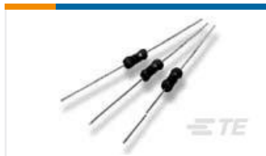
TE 产品编号3-1879354-3 RR03 5% 6R8 AMMO