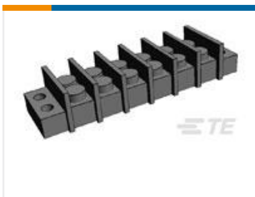
TE 产品编号1546306-6 6P .374" DR BARRIER STRIP