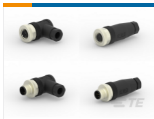
TE 产品编号T4110501021-000 M12 可现场安装非屏蔽式