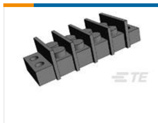
TE 产品编号1546306-4 4P .374" DR BARRIER STRIP