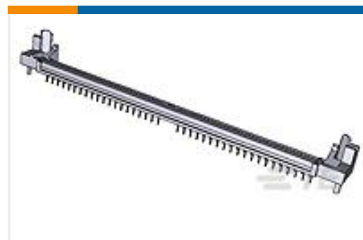
TE 产品编号5822138-4 80 ME .050 L/P AU M/L PB-FREE