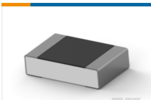
TE 产品编号9-2176374-8 RQ 0805 1K1 0.1% 10PPM 1K RL