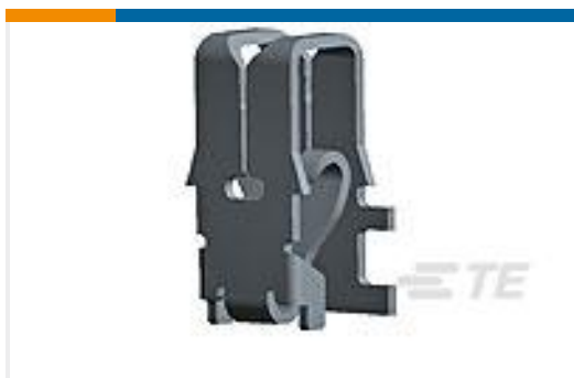
TE 产品编号964339-1 MAG MATE KONT. MKII