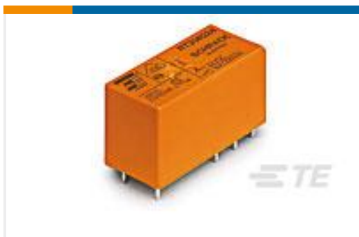
TE 产品编号2-1393243-4 RTE25524