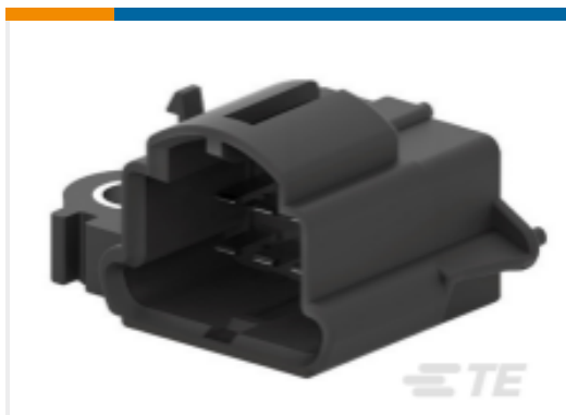
TE 产品编号828801-6 Low & Medium Power Header