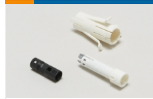
插头和插座照明连接器附件(57)