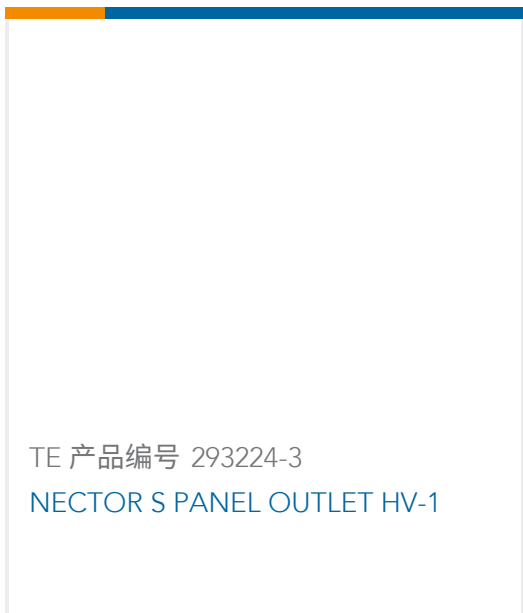
TE 产品编号 293224-3 NECTOR S PANEL OUTLET HV-1