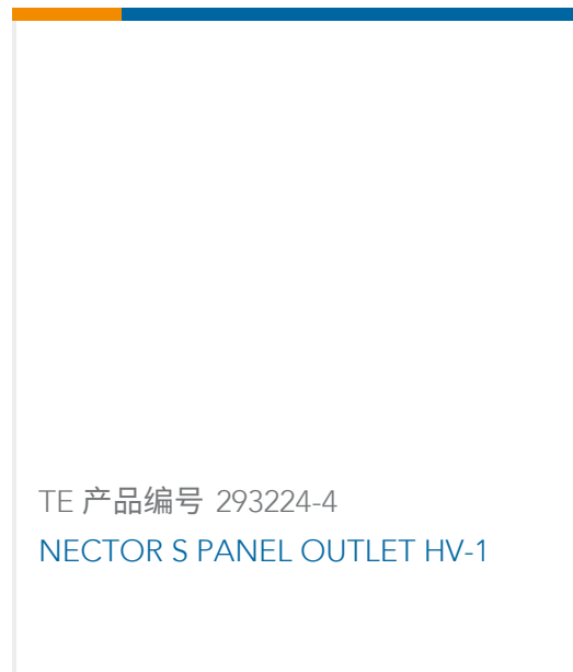
TE 产品编号 293224-4 NECTOR S PANEL OUTLET HV-1