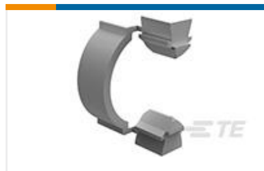
TE 产品编号1740261-2 NECTOR S RING CLIP BLACK