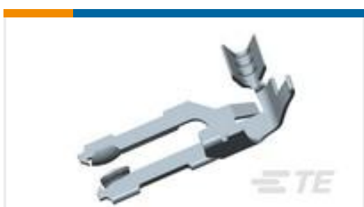
TE 产品编号926770-1 MT.EDGE CRIMP CONT.