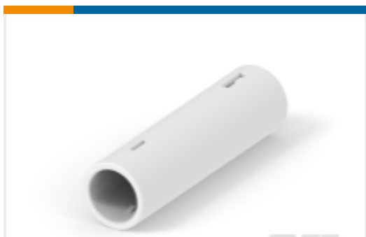
TE 产品编号293387-2 NECTOR S OUTLET HV-4 WHITE