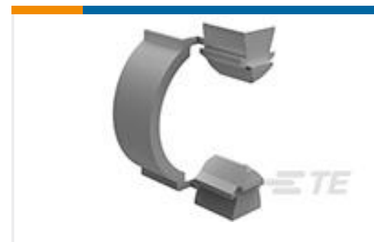
TE 产品编号1740261-1 NECTOR S RING CLIP WHITE