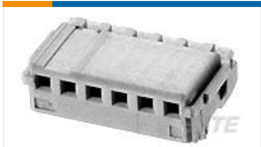
TE 产品编号353908-2 CT REC HSG 2P CRIMP TYPE WHITE