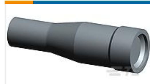
TE 产品编号293284-1 NECTOR S BUS BAR BOOT