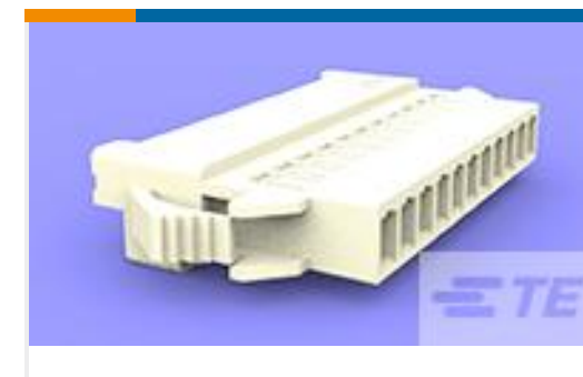
TE 产品编号1969590-4 HSG, REC, PANEL MOUNT, SINGLE ROW, EP2.5