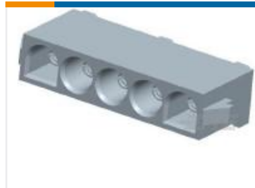
TE 产品编号2029361-1 05P UMNL SOC HDR V2 NATL NDH