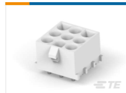
TE 产品编号5-2029002-1 09P UMNL HDR ASSY PC, NDH