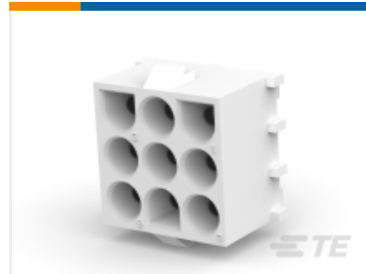
TE 产品编号2029002-1 09P UMNL HDR ASSY PC, NDH