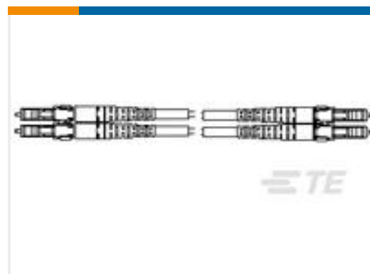
TE 产品编号2064915-3 C/A,F/O,2F I/O MM50 OM3,SCLC DPX