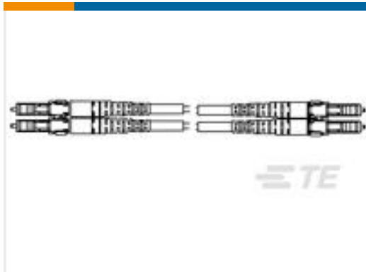
TE 产品编号2064915-8 C/A,F/O,2F I/O MM50 OM3,SCLC DPX, 8M