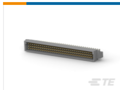
TE 产品编号650473-3 096 EURO TYPE C PIN ST ASSY