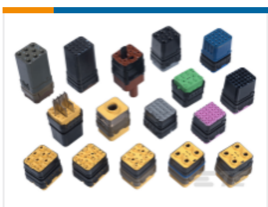
TE 产品编号ZPF000000000202094 DMC-M 0402 AW 01