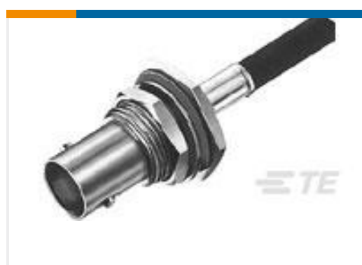
TE 产品编号225398-6 CONNECTOR, BNC DUAL CRIMP JACK