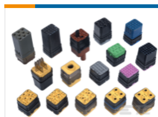
TE 产品编号ZPF000000000202094 DMC-M 0402 AW 01