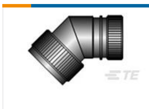
TE 产品编号CZ6862-000 HEX40-AC-45-25-A12-3