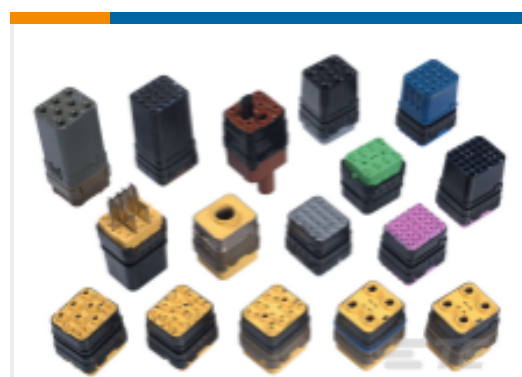
TE 产品编号ZPF000000000203708 DMC-M 99-10 PC