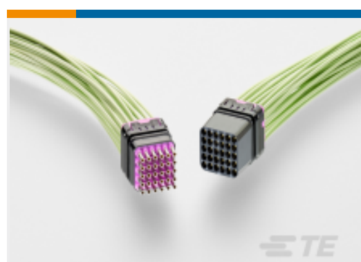
TE 产品编号ZPF000000000203399 DMC-MR 30-23 PD