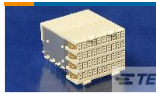
TE 产品编号2065657-1 zd Plus, 4 pair, receptacle assy