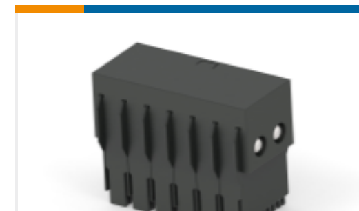
TE 产品编号2215003-1 ASSY, ST TL, STRADA ORTHO 4X6