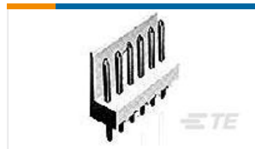
TE 产品编号1-171825-0 EIS HSG