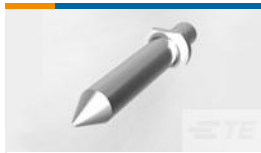
TE 产品编号223956-1 STV ERMZUB FUEHRUNGSBOLZEN J * M 1 ***