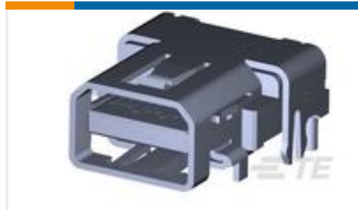
TE 产品编号2129320-3 Mini Displayport Reverse Offset