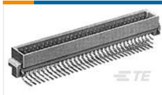
TE 产品编号5650948-5 ASSY,PIN,EUROCARD,TYPE C/2,LEA