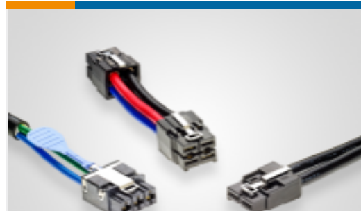
TE 产品编号2304883-1 CA,ET, 2POS, SHORT PULL-TAB,NO DETECT