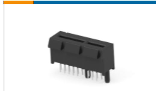
TE 产品编号3-2362375-1 PCIE GEN4, 36POS ,G/F ,DIP ,3.1mm TAIL