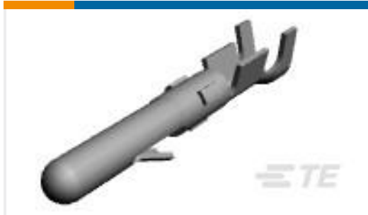
TE 产品编号61116-2 CMNL PIN 24-18 BR