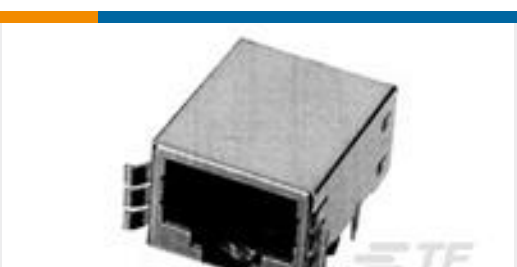
TE 产品编号1116503-2 MJ,10MM,8P,SHLD,NOPNL TABS,SN