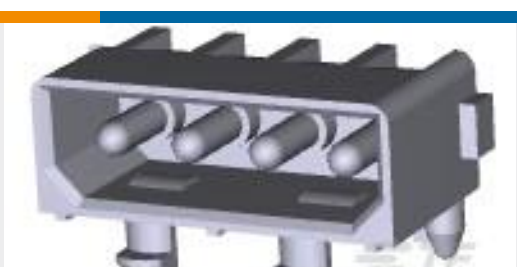
TE 产品编号1-641737-1 04P CMNL HDR ASSY R/A V0