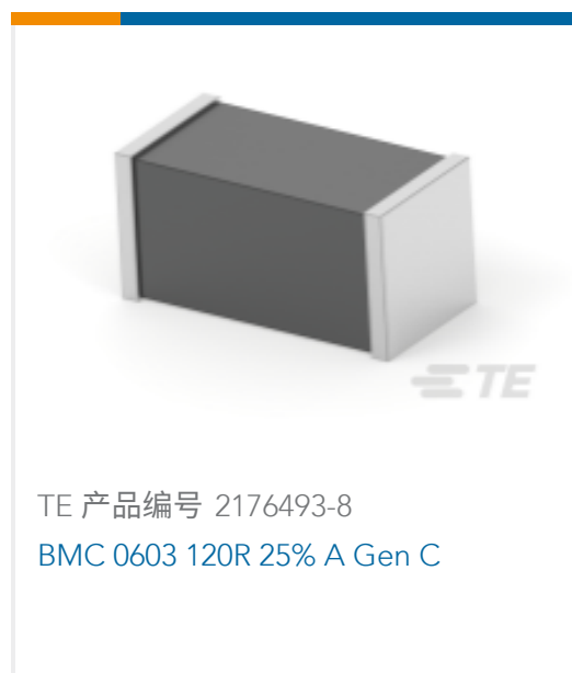
TE 产品编号 2176493-8 BMC 0603 120R 25% A Gen C