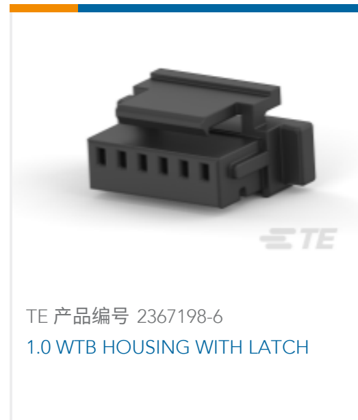
TE 产品编号 2367198-6 1.0 WTB HOUSING WITH LATCH