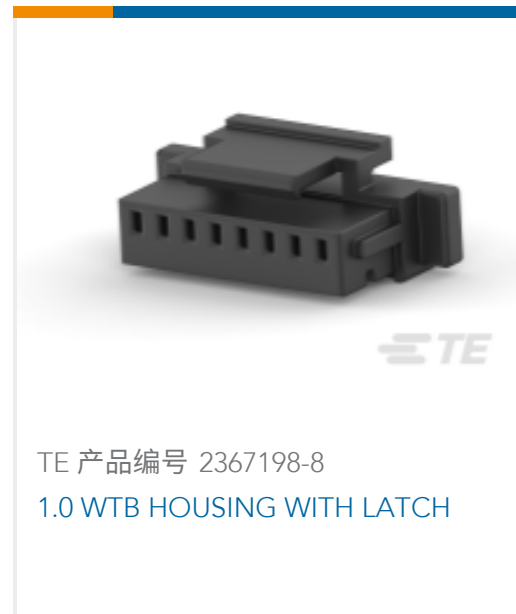
TE 产品编号 2367198-8 1.0 WTB HOUSING WITH LATCH