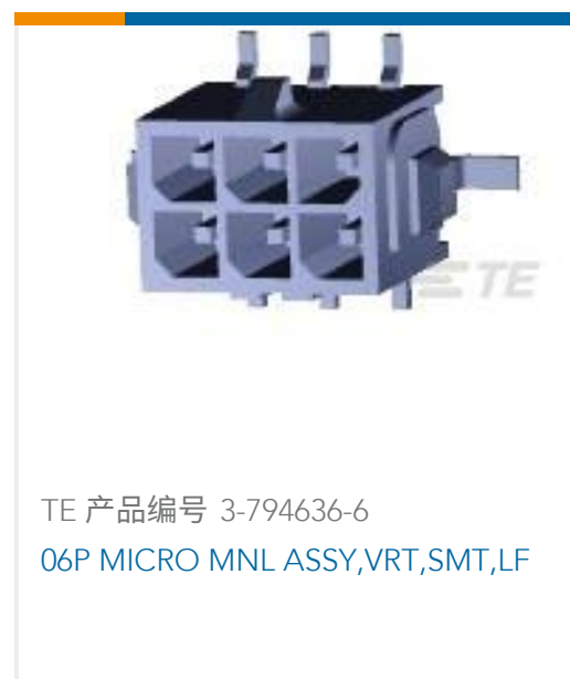
TE 产品编号 3-794636-6 06P MICRO MNL ASSY,VRT,SMT,LF