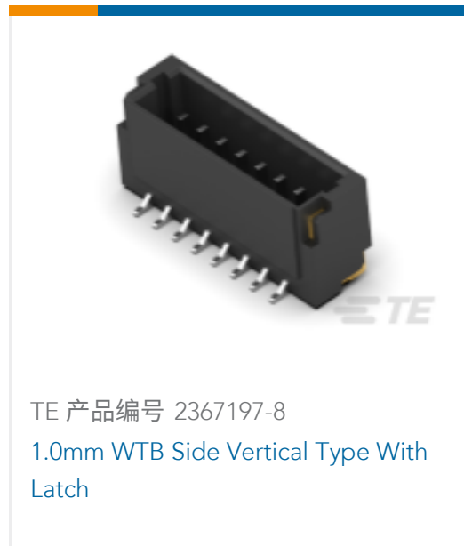
TE 产品编号 2367197-8 1.0mm WTB Side Vertical Type With Latch