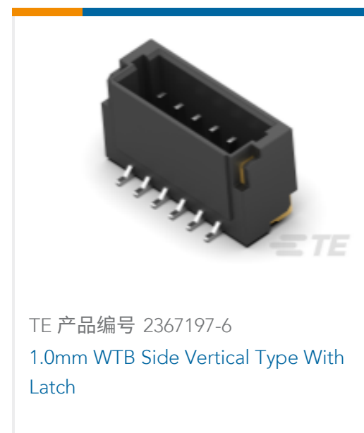
TE 产品编号 2367197-6 1.0mm WTB Side Vertical Type With Latch