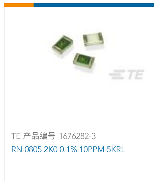
TE 产品编号 1676282-3 RN 0805 2K0 0.1% 10PPM 5KRL